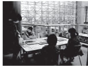
▲とりアート 2022 東部フェスタの様子