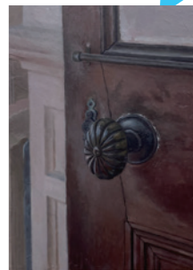
椿 美咲 《Keep going deeper all the way》