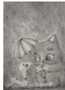
遠藤 聡志 《雨の日の出来事》