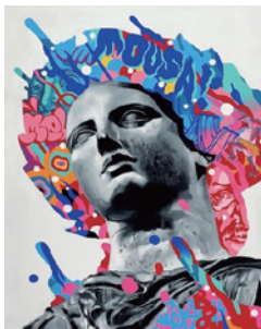
OBAN TAIKA 《Melpomene》

今回、はじめて本格的に実施する展示事業では、鳥取県出身・在住・在学の、美術を専門に学ぶ学生を中心に、油彩画、グラフィックデザイン、絵本、ファッションなど幅広い作品を展示いたします。自分だけの表現を目指し、日々、自分自身と向き合い励む、鳥取から羽ばたく若きアーティストの作品を、ぜひ多くの方にご覧いただければ幸いです。